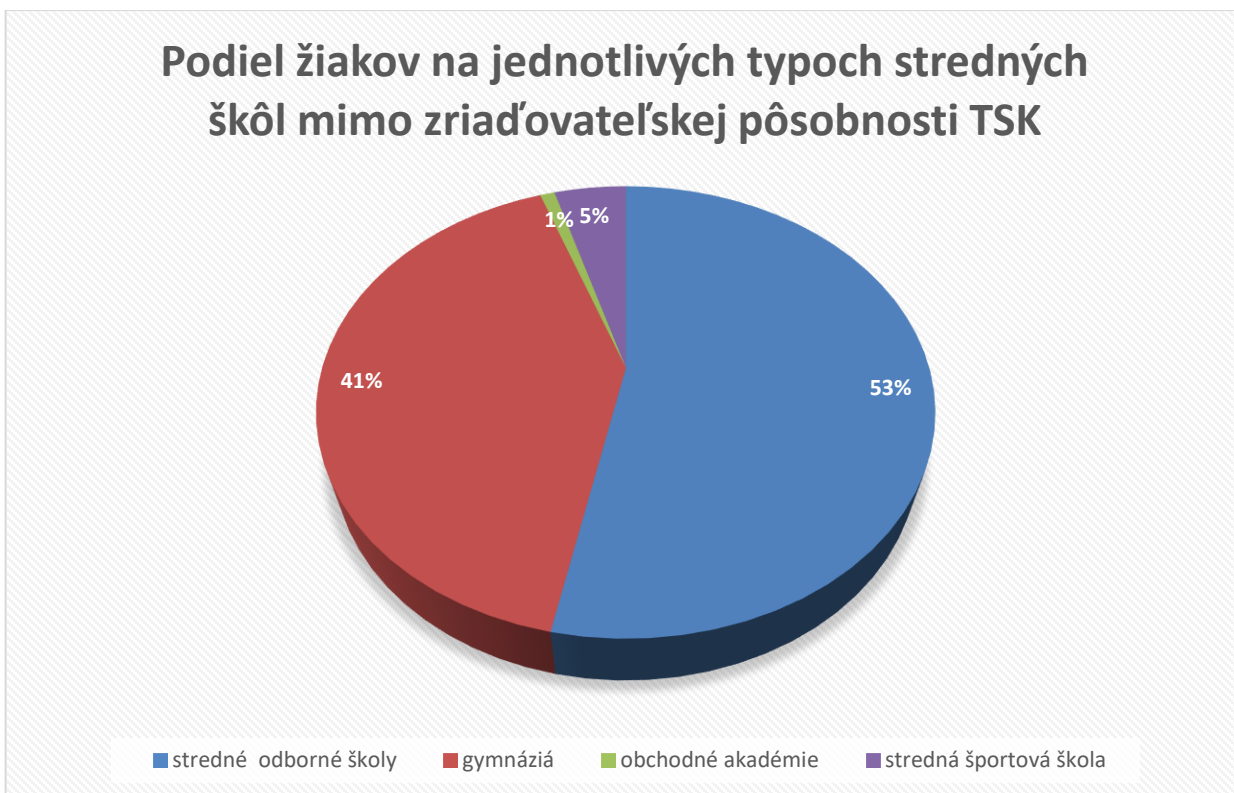
Graf č. 2: Podiel žiakov na jednotlivých typoch stredných škôl mimo zriaďovateľskej pôsobnosti TSK

Percentuálne zastúpenie žiakov na jednotlivých typoch škôl mimo zriaďovateľskej pôsobnosti TSK je znázornené na grafe č. 2.